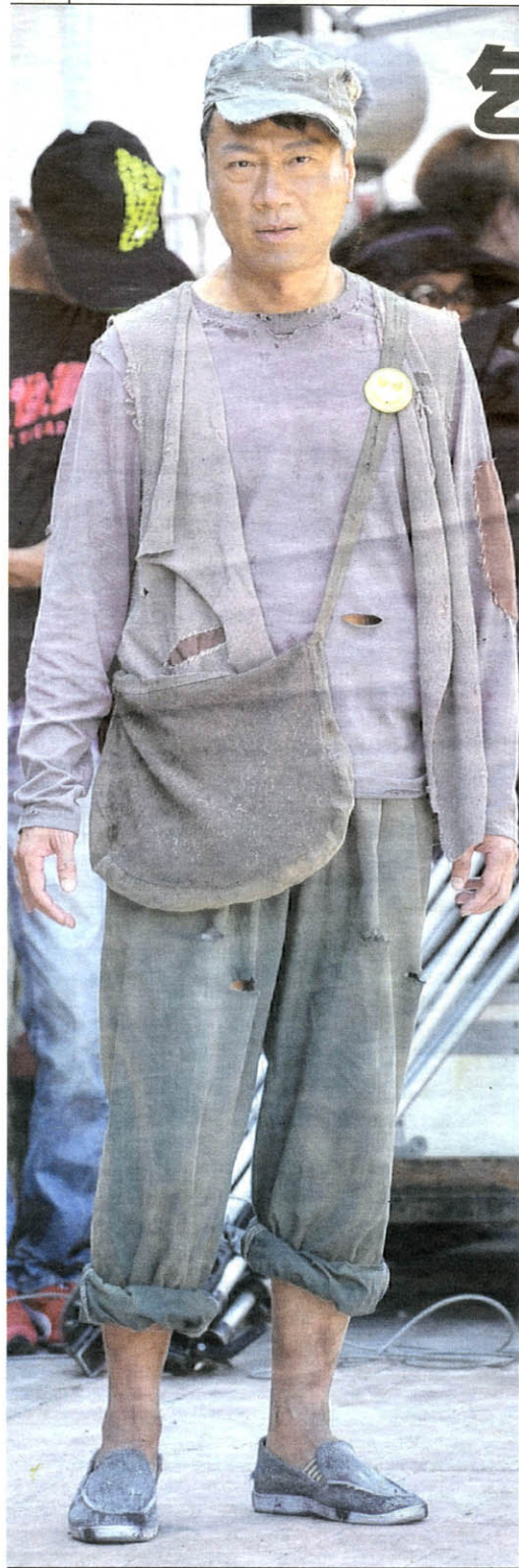
活灵活现 换上衣衫褴褛的乞丐装后，黎耀祥活像一名流落街头的乞丐。